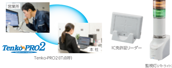
Tenko-PRO2 (IT点呼) IC免許リーダー 監視灯 (ライト)