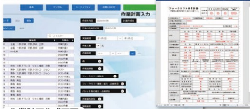
作業計画作成画面

事務所側解析ソフトにて、作業計画の作成やWord形式での出力を行うことができます。