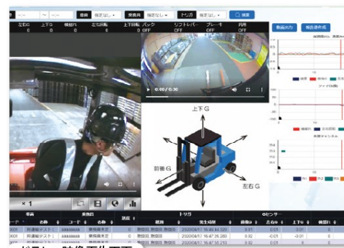
ドラレコ映像再生画面

自動で送信されたヒヤリハット映像を確認することができ、状況の把握や安全運転教育等に役立てることができます。