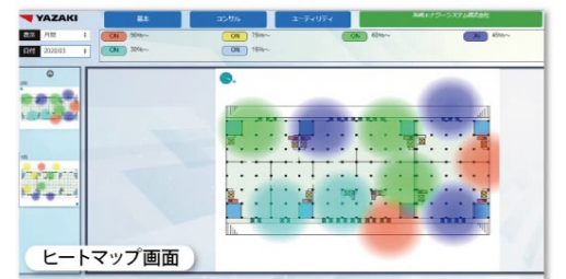
ヒートマップ画面

車両の移動状況を確認することができ、レイアウト改善等にご利用頂くことが可能です。(※倉庫内にビーコンの設置が必要)